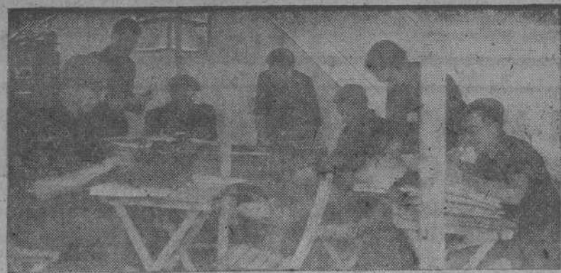
La Secretaría del Consejo Nacional del Frente de Juventudes, ha sido instalada en una tienda de campaña y en ella se trabaja desde la mañana hasta la noche. (Foto CIFRA).

ESTOCOLMO. 2.—Los defensores de Stalingrado deben luchar hasta morir, según les aconseja el órgano periodístico del Ejército rojo. Y añade: "Por dura que sea la empresa, ya no es posible retroceder y el enemigo debe ser rechazado a cualquier precio".—(EFE).