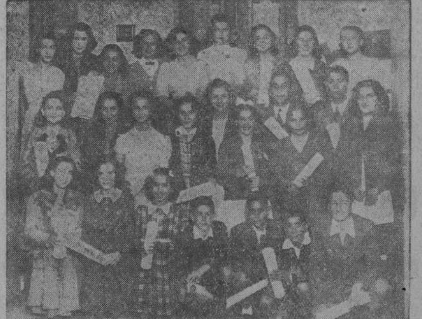
Alumnos del Instituto de Segunda Enseñanza a quienes les fueron entregadas ayer las matrículas de honor que obtuvieron en el último curso.

SINDICATOS. —Normas acordadas conjuntamente por la Delegación Nacional de Sindicatos y la del Frente de Juventudes, sobre colocación de aprendices.—(CIFRA)