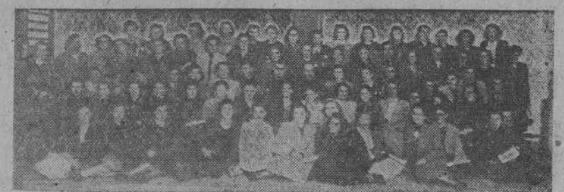
Grupo de concurrentes a la IV Asamblea Diocesana y Jornadas de Presidentas de las Jóvenes de A. C. celebradas en Santiago, desde el 25 al 29 de septiembre de 1942