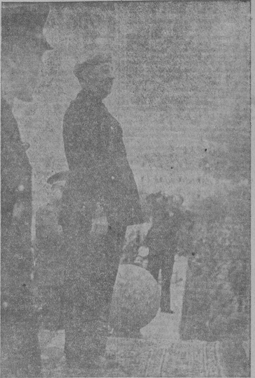
El Caudillo durante la sesión de clausura del II Consejo Nacional del Frente de Juventudes, en el Monasterio de El Escorial