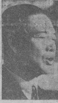
Wang Ching Wei, Presidente del Gobierno Nacional-chino