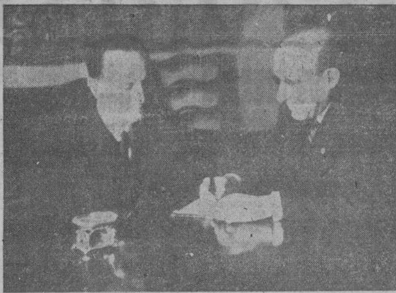
El nuevo Embajador de España en El Quirinal y miembro de la Junta Política, D. Raimundo Fernández Cuesta, es recibido por el ministro de Asuntos Exteriores durante su estancia en Madrid