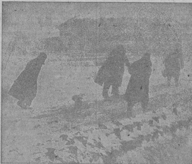
Durísima es la lucha que las fuerzas antibolcheviques tienen que sostener durante la temporada invernal en el frente del Este donde nieva casi constantemente y el termómetro llega a alcanzar hasta 40 grados bajo cero