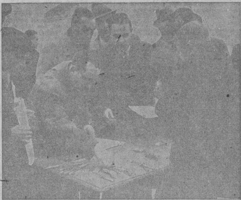
La Dirección General de Regiones Devastadas hace entrega al pueblo de Majadahonda de un grupo de 16 viviendas.