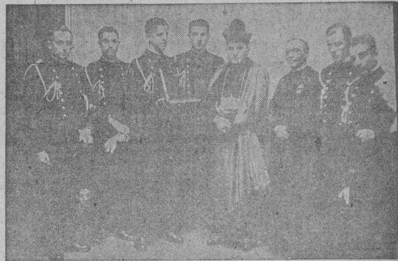
Comisión de guardia-marinas del minador "Vulcano" ante el señor Obispo de Mondoñedo