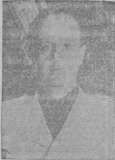
Abandonó el Embajador y su séquito abandonaron el Quirinal y regresaron a la "Villa Theodoli" en la que ha fijado su residencia particular. Su Excelencia. (EFE).

Durante la ceremonia de la entrega de cartas credenciales, no se pronunciaron discursos. El Rey Emperador conversó durante unos quince minutos con el Embajador. A continuación, Fernández Cuesta, presentó al Soberano al personal de la Embajada, con los que conversó unos momentos antes de despedirse. Con el mismo pro-