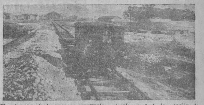
El automotor de la empresa constructora circula ya desde la estación de La Coruña hasta cinco kilómetros antes de Uges