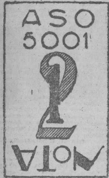
Título de película

Canadá produce los dos tercios del mundo