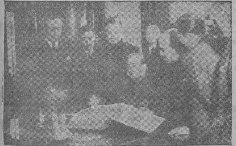
El Delegado Nacional de Prensa firmando en el Libro de Oro de la ciudad durante su visita al Palacio Municipal.

Después de saludar y cumplimentar a nuestra primera autoridad militar, el camarada Aparicio fué al Ayunta-