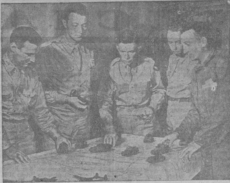
Cadetes de aviación estudiando un problema de combate terrestre. Antes de hacer vuelos de entrenamiento, los alumnos han de saber reconocer en el aire los aparatos amigos y enemigos.