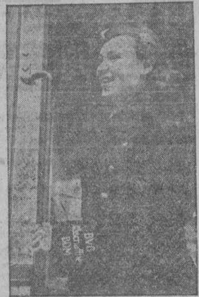
Una joven alemana que hace servicio de cobradora en los tranvías berlineses, en virtud de la movilización total