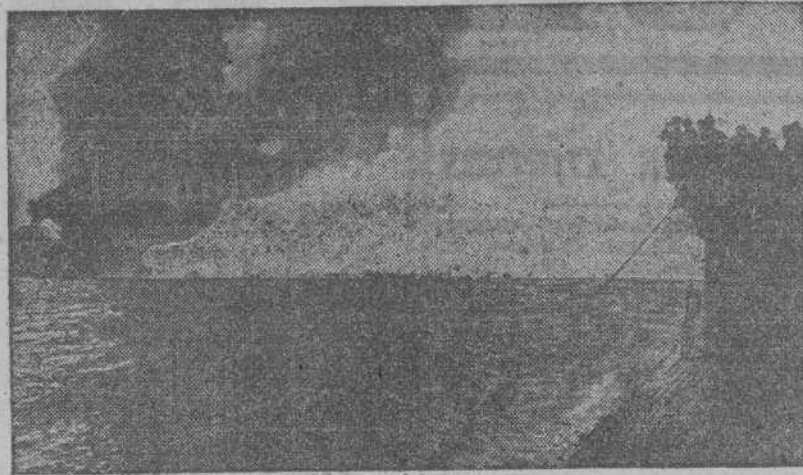
Desde el submarino alemán que acertadamente ha dirigido su torpedo, ven los últimos momentos de un petrolero enemigo, antes de sepultarse en las aguas