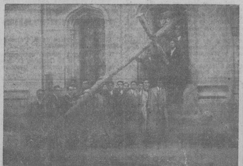
La Cruz de 230 kilos, que con gran devoción portaban los jóvenes de La Coruña, en la procesión de penitencia, celebrada con motivo de los Ejercicios Espirituales, que con ejemplar asiduidad y recogimiento vinieron practicando en la iglesia del Sagrado Corazón.

Los soldados franceses han jurado luchar con las armas en la mano por una nueva Europa y un porvenir mejor.—(EFE.)