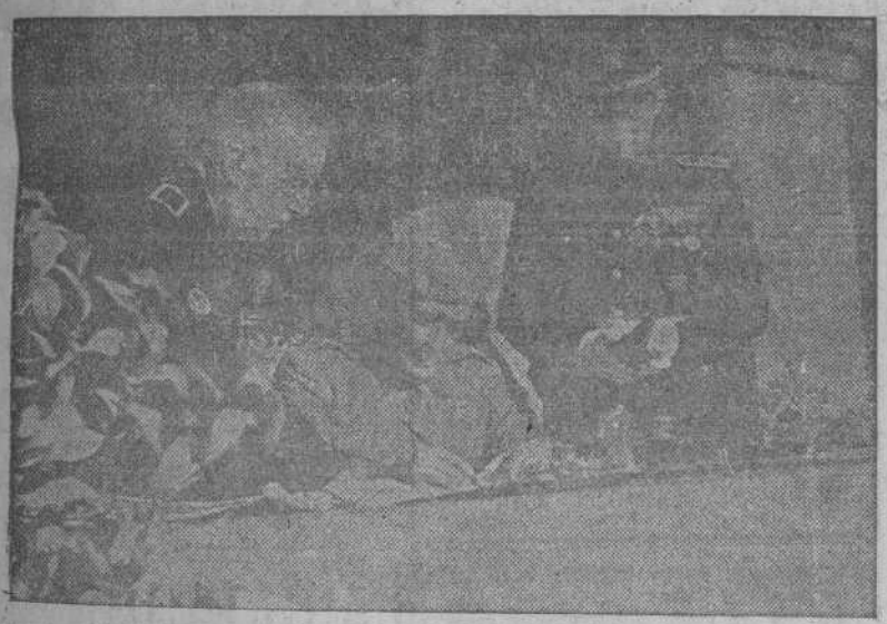
El Caudillo hace la cesión de 80 viviendas protegidas a sus beneficiarios