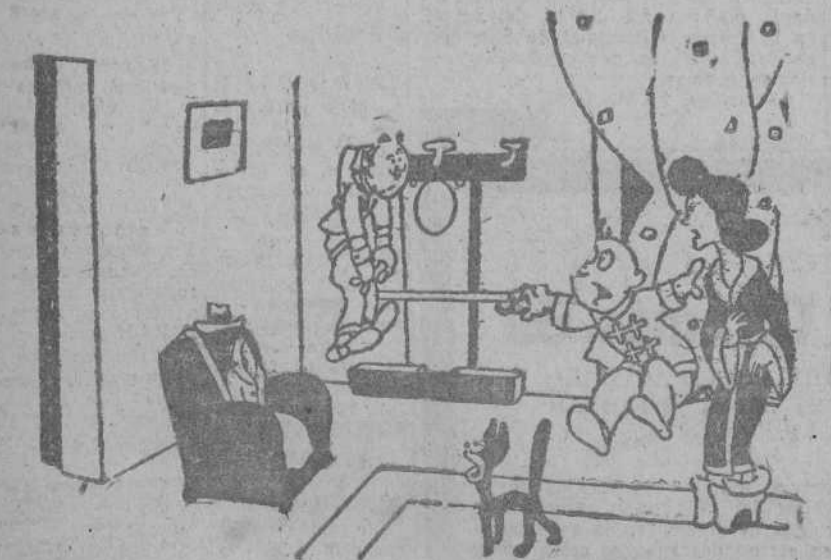
UN OPTIMISTA, por Bellón — ¡Ea, amigos míos! Ya me tenéis sentado en esta butaca después de curarme totalmente de mis distracciones y olvidos...