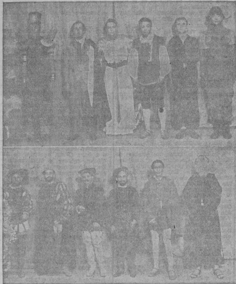
Arriba: Escuadra de Granada, que obtuvo el primer premio.—Abajo: Escuadra de Valencia, segundo premio en la competición nacional

A continuación quedaron clasificadas las de Valencia, Sevilla y Barcelona