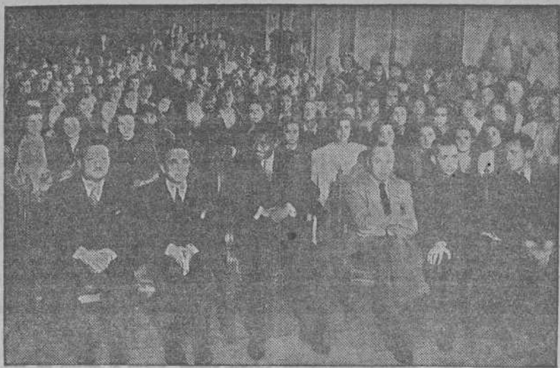
El hijo de S. A. I. el Jalifa en la fiesta gallega dada en su honor en el Instituto de Segunda Enseñanza, de La Coruña