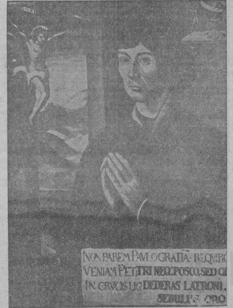
Este magnífico retrato de Copérnico, cuyo 400 aniversario se celebra ahora, es obra de un pintor contemporáneo suyo.