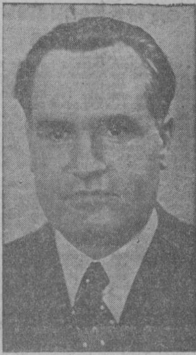
Excmo. Sr. Don Demetrio Carceller, Ministro de Industria y Comercio

LLEGA EL MINISTRO El ministro de Industria llegó a la Feria poco después de las once, acompañado del subsecretario de Comercio. El señor Carceller fué saludado por las autoridades y jerarquías y por el presidente del Comité ejecutivo del Certamen, que le dieron la bienvenida. La compañía de Infantería rindió los honores correspondientes, revistando las tropas el señor Carceller en compañía del laureado teniente general Moscardó. Seguidamente, el ministro, autoridades, jerarquías, personalidades y representaciones penetraron en el salón de actos del Palacio de proyecciones, donde se efectuó la apertura oficial. El amplio salón del Palacio estaba profusamente decorado y con depurado gusto, adornado con riquísimos damascos, presidido todo por un busto del Caudillo, y al fondo, por la bandera nacional.