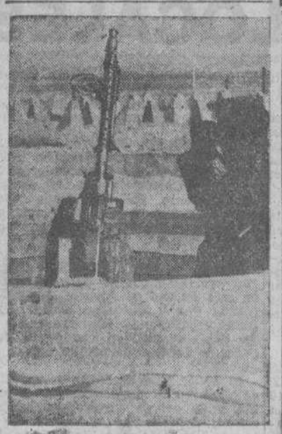
Lo que antes fue una playa de veraneantes hoy es una posición fortificada por los alemanes. En la playa pueden verse los pilones de cemento que forman una barrera de protección anti-tanque

Otros 51 barcos han sido gravemente averiados