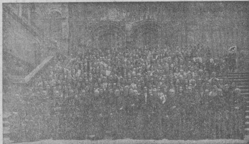
Santiago.—Los peregrinos de Valencia (unos trescientos) después de ganar el Jubileo.

SANTIAGO, 8.—Ha hecho su entrada en el día de hoy en la Catedral una peregrinación compuesta por cien señoritas de la Juventud de Acción Católica de Sevilla, todas ellas ataviadas con la