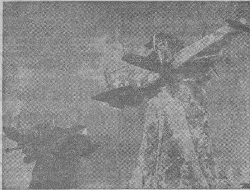
Estos modelos de aviones, toscamente contruados, forman parte del tocado actual de los curanderos, o médicos "ju-ju", del Africa Central, cuando acuden a sus ritos para expulsar a los malos espíritus.