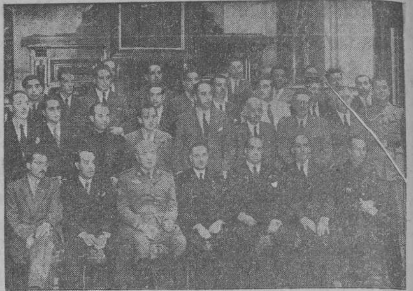
Aspirantes a secretarías municipales de tercera categoría que asistieron a un cursillo celebrado en la Universidad compostelana y que ayer visitaron La Coruña (Foto "El Ideal Gallego").