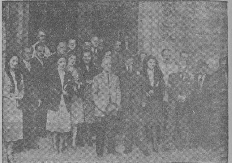
El Delegado de Hacienda con los funcionarios a sus órdenes que asistieron a la misa celebrada en sufragio de Calvo Sotelo.