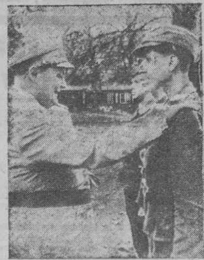
El Mariscal del Reich, Goering, en Hamburgo, conversando con un grupo de jóvenes ayudantes de la defensa antiaérea