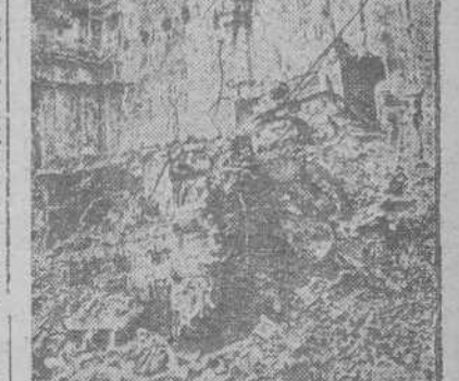
Un aspecto del templo gótico de Santa Clara, panteón de los reyes napolitanos de la Casa de Anjou, después de los últimos bombardeos aéreos