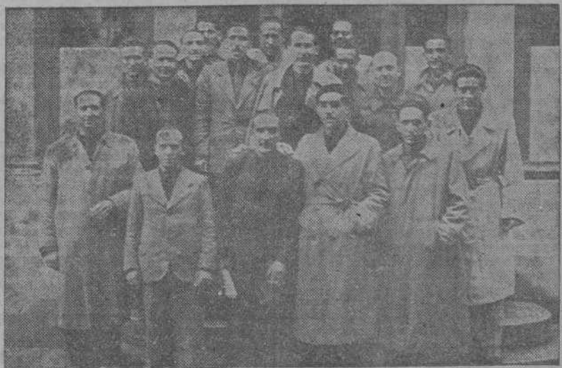
Instructores elementales del Frente de Juventudes a quienes les han sido entregados los títulos correspondientes.