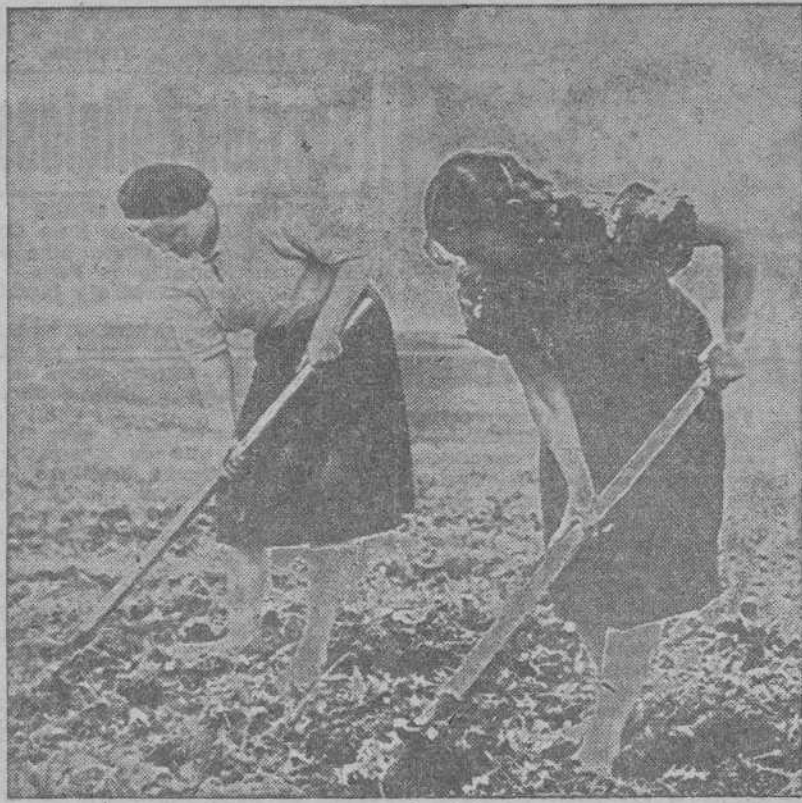
Después de la recolección de este año en las tierras de Ucrania, las mujeres se ocupan de cavar los campos antes de hacer la nueva siembra

MELBURNE 14.—Un comunicado del general Mac Arthur anuncia la captura de Salamaua. Asimismo comunica que las tropas aliadas han cerrado la tenaza alrededor de Lae, que ha sido intensamente bombardeado por la aviación.—(EFE).