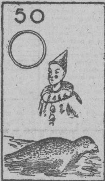
¡Qué calor hace!

Solución al crucigrama de ayer: Horizontales: A. Casia. B. Caserta. C. Actores. D. Oha. Ene. E. Lechada. F. Aro. Leda. G. Ana. Rob. Verticales: 1. Ca. 2. Caolin. 3. Cachera. 4. Astaco. 5. Casco. 6. Irreal. 7. Atender. 8. Aseado. 9. Ab.