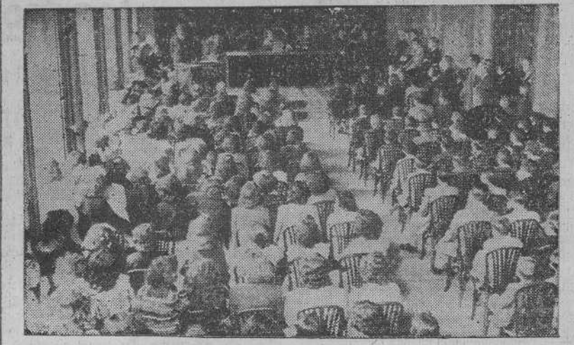
Aspecto del salón de actos del Instituto de Enseñanza Media, durante la apertura de Curso.

Se celebró ayer a las doce de la mañana el acto solemne de la apertura del curso académico 1943-44 de los Institutos masculino y femenino de Enseñanza Media, de esta capital. El acto tuvo lugar en el parafino de dichos centros y asistieron autoridades, jerarquías, representaciones de centros docentes, y los alumnos y alumnas de ambos Institutos. Como preparación al solemne acto