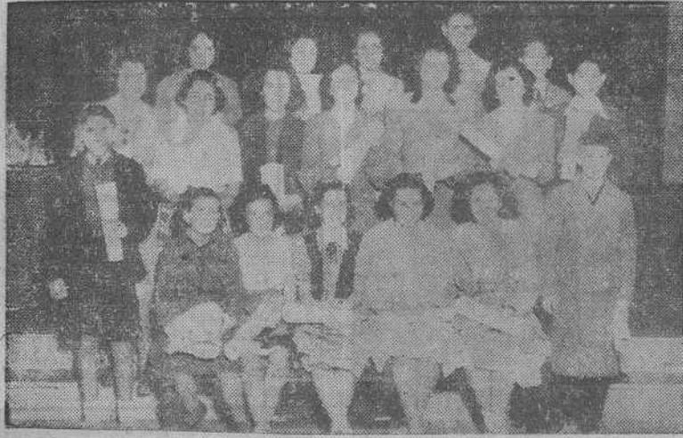
Alumnos de los Institutos de Enseñanza Media de La Coruña premiados en el pasado curso y que ayer recibieron los correspondientes diplomas