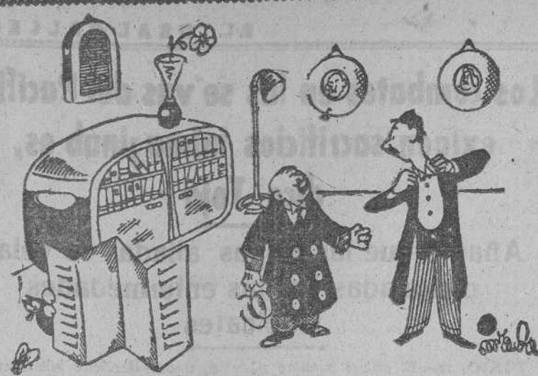
TRANSFORMACION, por Miranda

El traslado de los heridos graves se efectúa directamente de buque a buque cruzándose unos y otros a su paso por