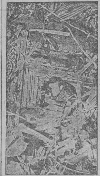
Desde un nido de ametralladoras, este soldado norteamericano dispara contra las líneas japonesas en Nueva Guinea