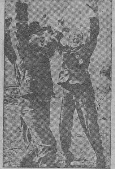
Un grupo de aviadores alemanes aprovechan sus ratos de descanso con un juego de bolos construido por ellos mismos