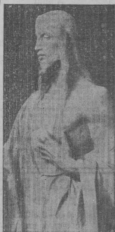
Magnífica talla del Sagrado Corazón de Jesús, obra de Benlliure, que el ilustre escultor ha regalado al Reformatorio de Adultos de Alicante, donde ha sido entronizada..