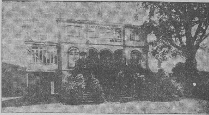
El Pazo del Carmen, que será reformado para adaptarlo a su nuevo destino: Reformatorio de Menores

Tendrá talleres, salas de clase, cine y gabinetes de estudio