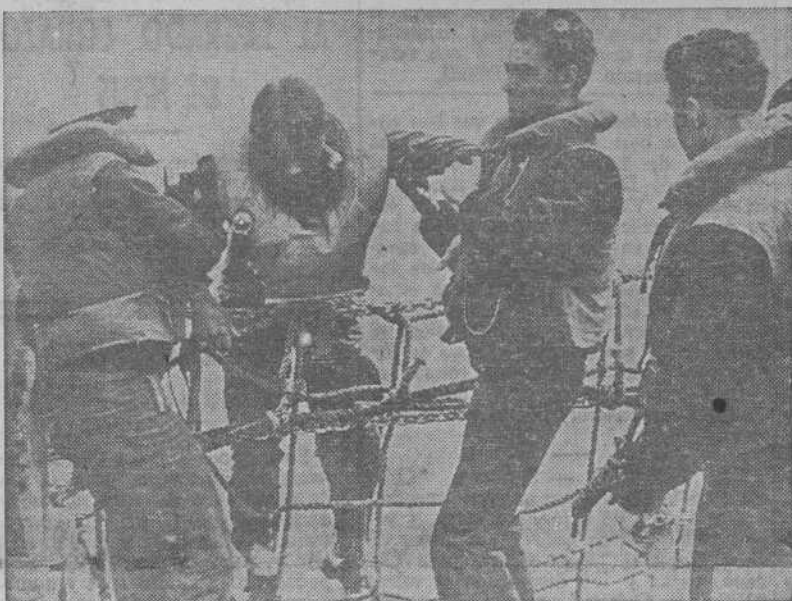
La guerra en los mares prosigue sordamente. He aquí dos aspectos del salvamento de unos náufragos en pleno Atlántico. (Fotos CIFRA).