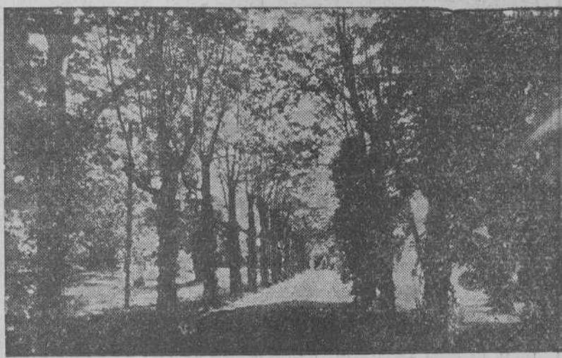
Vista parcial del hermoso parque del Pazo del Carmen, adquirido por la Junta Provincial de Protección de Menores para transformarlo en un modernísimo Reformatorio

Los consumidores de clavazón que presenten los solicitados en la primera decena del mes pasado, pueden pasar a recoger la correspondiente autorización por estas oficinas, de cinco y media a siete de la tarde. Dichas autorizaciones se entregarán exclusivamente a los interesados, mediante la presentación de la Tarjeta de Consumidor y documentos de identidad.