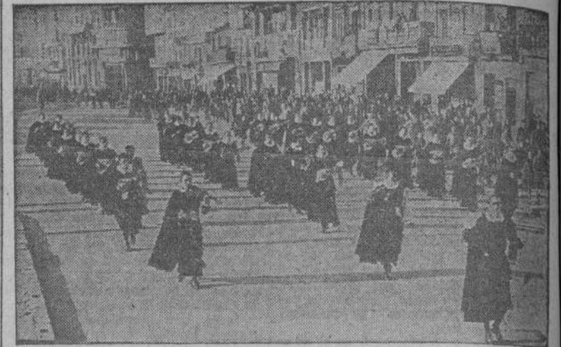
La Estudiantina Compostelana desfila por la Avenida de los Cantones a los acordes de un alegre pasodoble

Cumplimentó a las autoridades y dió dos conciertos en el Teatro Rosalía Castro