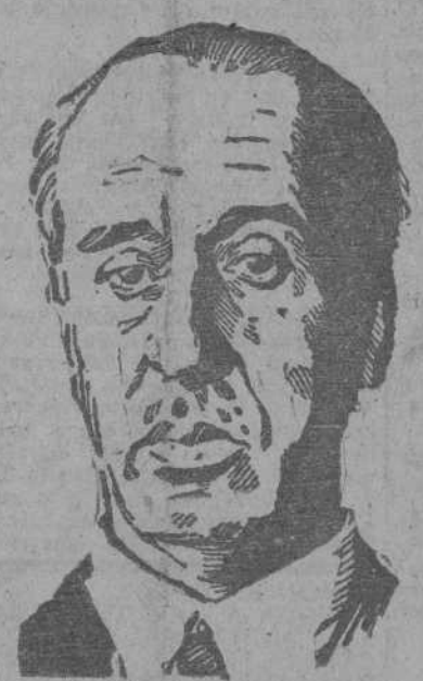
Excmo. Sr. D. Joaquín Benjumea Burín, Ministro de Hacienda