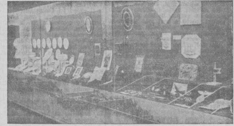
La interesantísima sección de Cerámica.

leres de esta provincia, ha hecho que en esta exposición figuren trabajos muy bien ejecutados que revelan un conocimiento técnico o artístico, según la especialidad a que cada expositor se dedica.