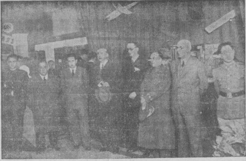
Las autoridades y jerarquías que presidieron la inauguración de la II Exposición de trabajos de Aprendices del Frente de Juventudes

El Frente de Juventudes inauguró solemnemente ayer a las siete de la tarde la II Exposición provincial de trabajos de aprendices. La magnífica exposición está instalada en la planta baja del edificio que en la calle Real ocupa el F. de J. y en los trabajos que figuran en los diversos departamentos se acusa un notable progreso respecto al certamen llevado a cabo el pasado año. Un afán de superación en los aprendices de los ta-