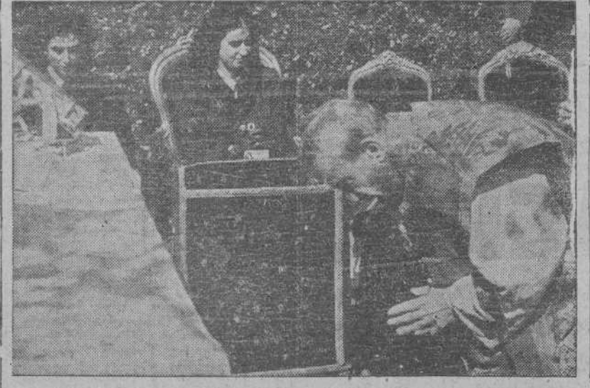
En la mañana del domingo último, la esposa de S. E. el Generalísimo doña Carmen Polo de Franco, inauguró un hogar-internado para niñas ciegas. Un momento de la ceremonia religiosa.