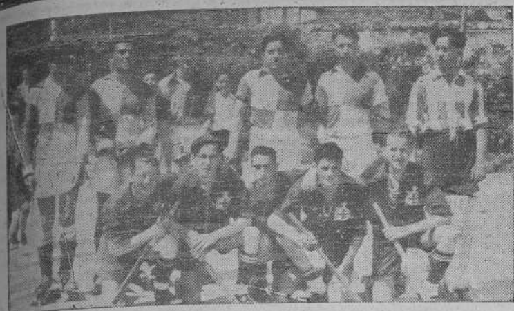
Los equipos de hockey sobre patines del Real Club Deportivo y del Liceo de Monelos que jugaron ayer el primer partido del campeonato, venciendo el Deportivo.