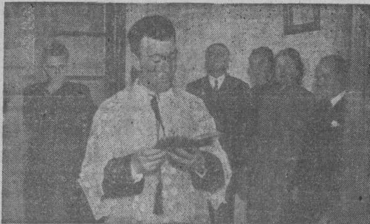
Bendición del "Hogar Juvenil Juan Canalejo", del Frente de Juventudes

El Frente de Juventudes proyecta la instalación de una Residencia, en la que se darán enseñanzas agrícolas