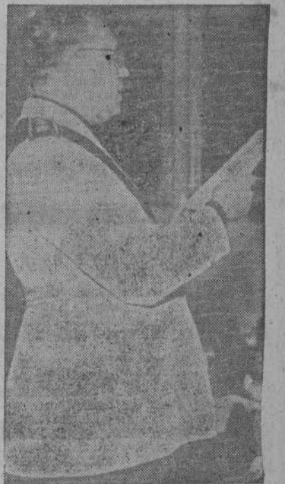
En la Real Academia de Ciencias Morales y Políticas ha sido recibido como académico de número el Ministro de Justicia don Eduardo Aunós. He ahí al Ministro durante el discurso