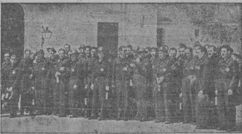
La masa coral de los mineros de Almadén y la rondalla de Alcázar de San Juan que actuaron en presencia del Jefe del Estado en el Palacio de El Pardo