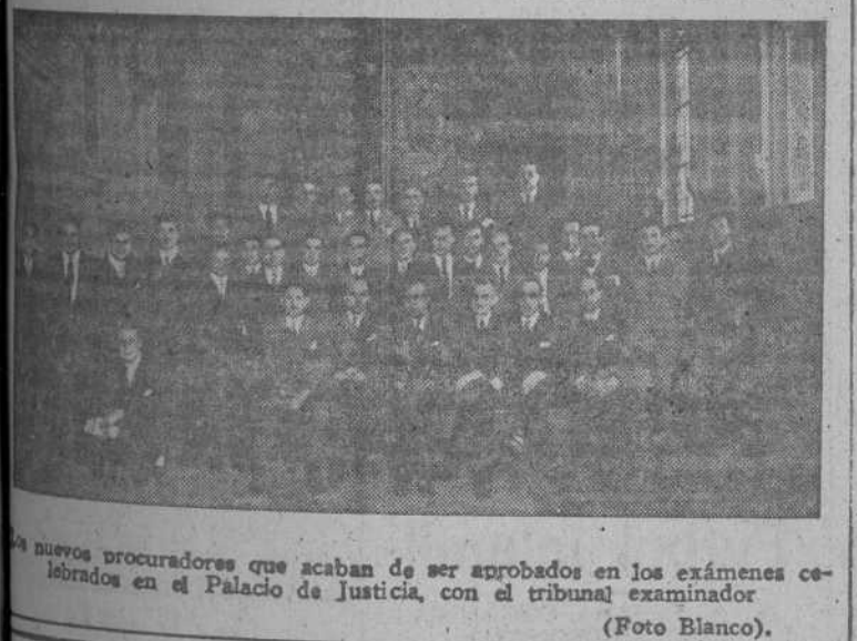
Nuevos procuradores que acaban de ser aprobados en los exámenes celebrados en el Palacio de Justicia, con el tribunal examinador.