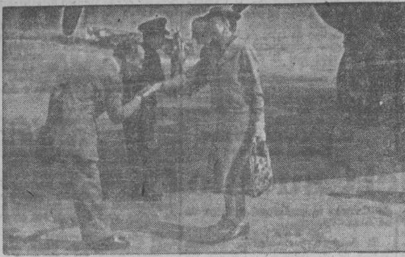
El Embajador de Su Majestad Británica en Madrid, sir Samuel Hoare, regresó a España procedente de Londres. Momento de la llegada al aeropuerto de Barajas.