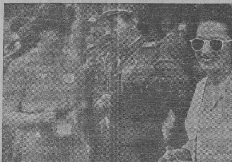
El general Muñoz Grandes, jefe de la Casa militar de S. E. el Generalísimo, entrega su donativo a las señoritas postulantes de la Fiesta de la Banderita, celebrada en Madrid