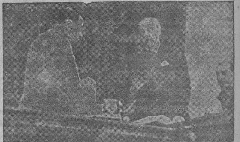
En el salón de sesiones del Palacio de las Cortes Españolas, se ha celebrado bajo la presidencia de don Esteban Bilbao, la jura de los nuevos procuradores. La foto captó el momento de jurar el Ministro de Asuntos Exteriores señor Lequerica