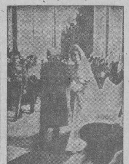
En la Santa Iglesia Catedral, de Sevilla, se ha celebrado el enlace matrimonial de S. A. R. la Princesa doña Esperanza de Borbón y Orleans, con S. A. I. y R. el Príncipe don Pedro de Orleans Braganza.

SEVILLA, 19.—Antes de embarcar para Petrópoli (Brasil), donde fijarán su residencia, el príncipe don Pedro y la princesa Esperanza harán un viaje nupcial por España. Los primeros días los pasarán en Cádiz y Algeciras; luego visitarán Madrid y Barcelona, y, más tarde, en peregrinación, marcharán a Santiago de Compostela y a Fátima. Terminado su recorrido por las principales ciudades lusitanas, los príncipes volverán a Sevilla, y en el mes de marzo del próximo año embarcarán rumbo al Brasil.