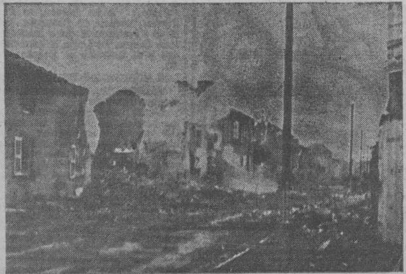
Cada localidad es defendida con todo arroyo y energía por los soldados alemanes. Este documento gráfico da idea exacta de la violencia de la lucha en un pueblo de la Lorena