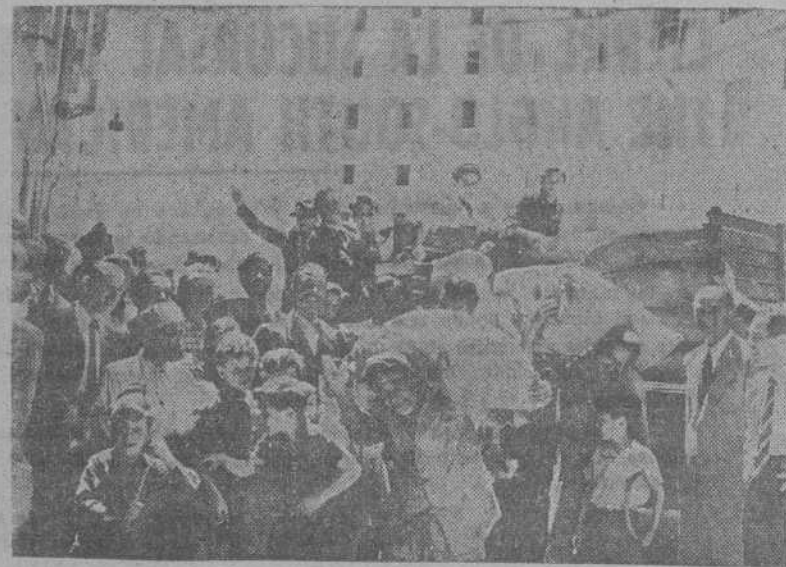
Un grupo de ciudadanos italianos contempla jubilosamente los sacos de harina que descargan de un camión frente a una panadería en Roma

Teléfonos de EL IDEAL GALLEGO Admón. 1542; Redacción 1177 y 1594