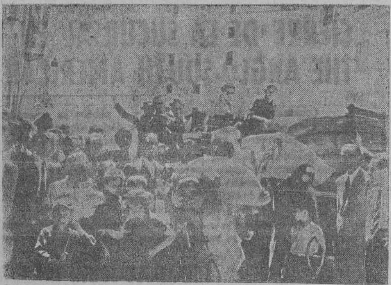
Un grupo de ciudadanos italianos contempla jubilosos los sacos de harina que descerzan de un camión frente a una panadería en Roma