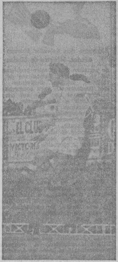
Doce hombres y un balón en el aire. La jugada, como otras muchas, se resolvió sin consecuencias para la meta madrileña (Fotos Gil del Espinar).

Tenemos noticias de que existen gestiones en pro del resurgimiento del histórico y señorial Artabro coruñés, cuya ausencia desde seis años, creó un vacío enorme en el ambiente deportivo coruñés. El Artabro, como el Cairo Ballas y otros, debe reaparecer cuanto antes, y al frente de sus secciones—tenis, hockey sobre campo y de patines, etc.—cumplir la brillantísima misión a la que, de acuerdo con su rango y solera, tiene derecho. Otro día hablaremos más detalladamente. Por hoy, celebráramos que esos rumores tomaran realidad.—ARGOS.