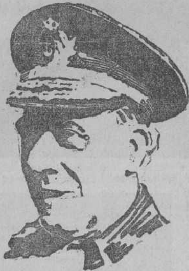
Almirante don Salvador Moreno Fernández, Ministro de Marina

—El pasado y el presente de España—y principalmente su porvenir—