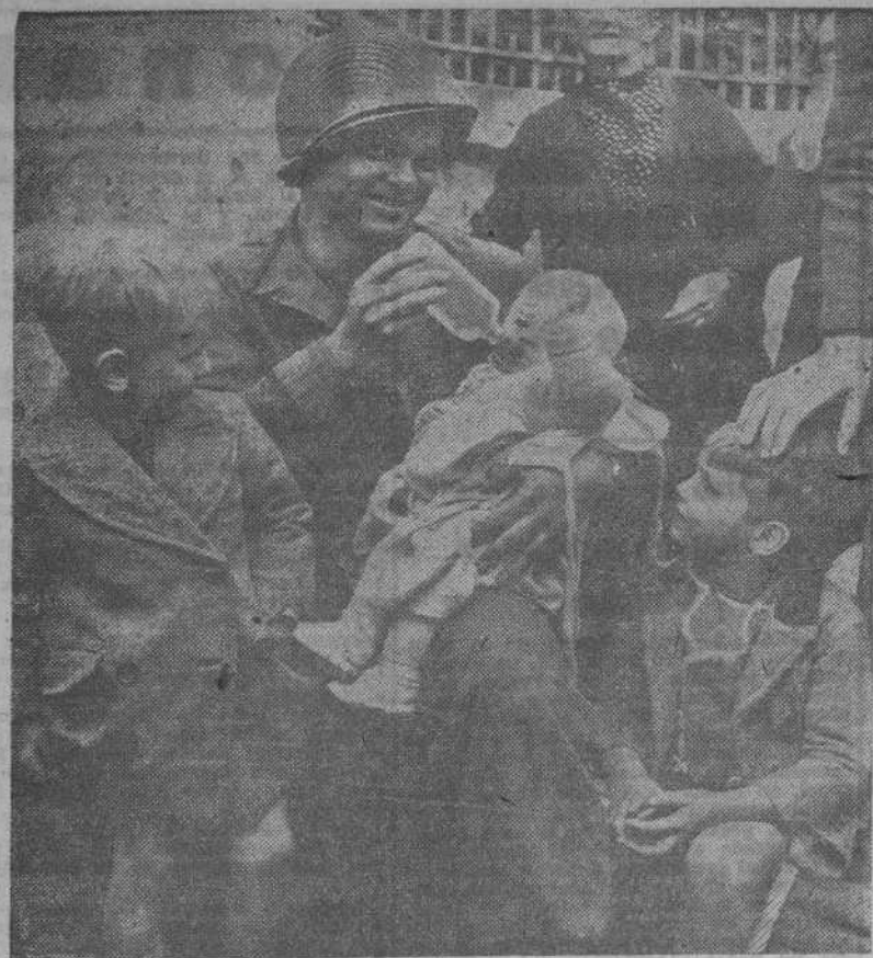
Rodeado de unos admiradores, este soldado norteamericano se dedica a la placida tarea de dar el biberón a un infante en una ciudad francesa liberada recientemente