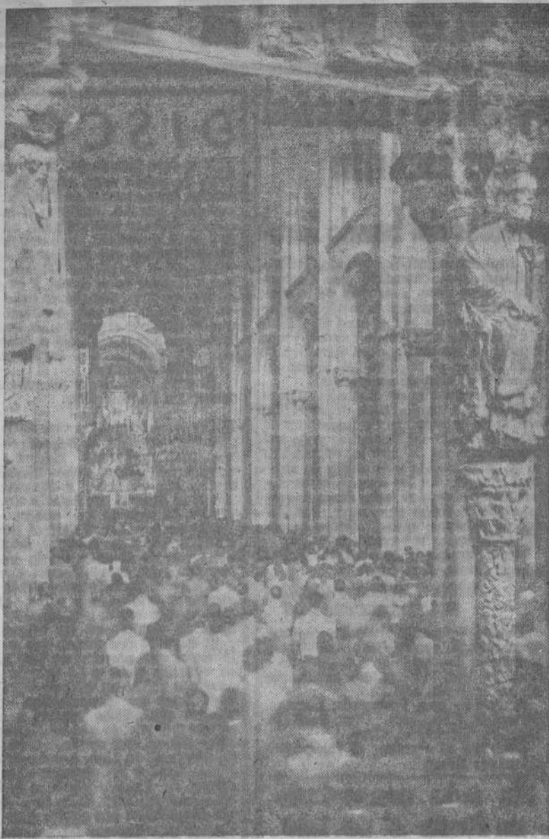
Aspecto que ofrece la nave central de la Catedral compostelana, vista desde el Pórtico de la Gloria, después de las obras ejecutadas para el traslado del Coro.