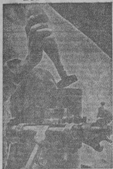
Un granadero alemán preparando el nuevo disparo de mortero contra las posiciones angloamericanas en el frente occidental