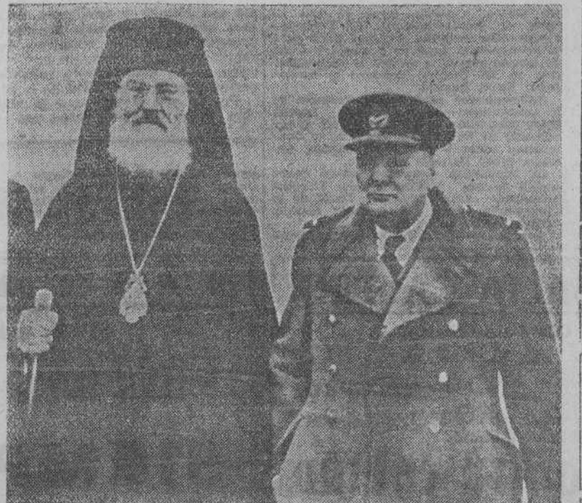
El Arzobispo Damaskinos, Regente de Grecia, con Mr. Churchill, que, al regresar de la conferencia de Crimea, ha vuelto a visitar Atenas

En los centros oficiales de París se explica que, aunque Francia no haya asistido a las conferencias de Dumbarton Oaks y Yalta, ha de ser informada de ellas con detalle, para que pueda definir su actitud en todos los puntos.—(EFE).