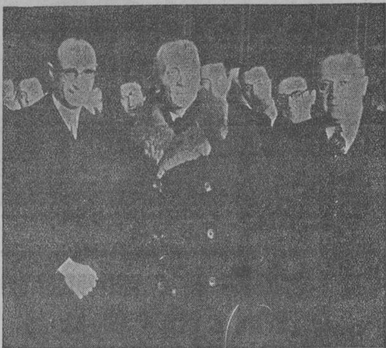
El nuevo embajador de Italia en España, Duque de Gallari, a su llegada a Madrid