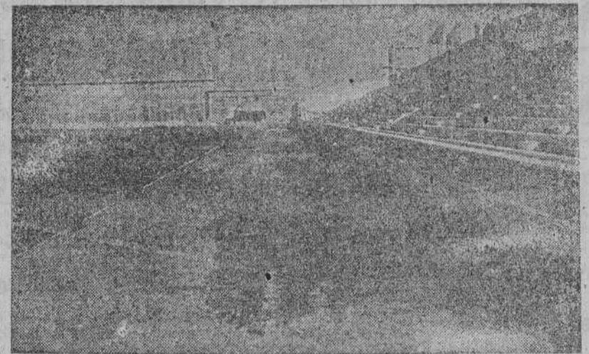
Un aspecto parcial del Estadio coruñés. Fácilmente puede apreciarse el magnífico estado de la pista atlética, en una gran parte completamente terminada.

También dió su aprobación a otro proyecto sobre arreglo de calles