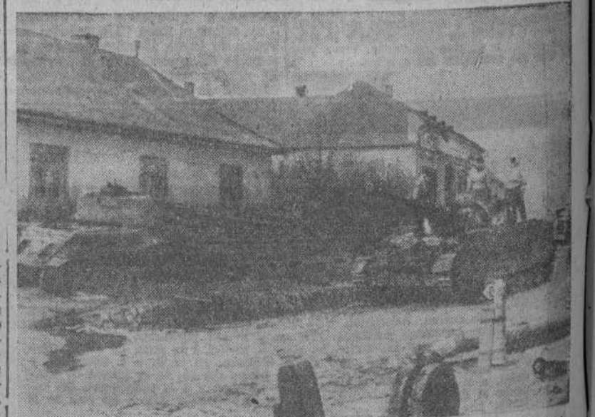
Después de haber sido expulsados los bolcheviques de un pueblo de la Prusia Oriental, por todas partes se ven restos de sus armas blindadas