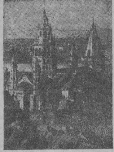
CATEDRAL DE MAGUNCIA

BERLIN 23.—En relaci n con los combates que se libran entre el Sarre y el Rin, la Oficina de Informaci n Internacional dice que el gran ataque del tercer Ej rcito norteamericano que ha roto el frente del Mosela con sus fuertes cuñas blindadas y ha iniciado de esta manera una guerra de movimientos en el Hesse y en el Palatinado, persigue un doble objetivo: alcanzar la orilla izquierda del Rin y cortar a las fuerzas alemanas que se encuentran entre las cuñas blindadas. Los ataques con nuevas fuerzas blindadas de infanter a motorizada contra Maguncia fueron contenidos nuevamente ayer con grandes p rdidas de blindados, en los pueblos situados delante de la cabeza de puente. Entre Maguncia y Worms han ocupado los atacantes, despu s de haber sido evacuada la cabeza de puente de Oppenheim, posiciones en la orilla Oeste. Aceler ndose concentraron material de pontoneros en cantidad considerable e importantes fuerzas motorizadas. Sin duda hacen preparativos para alcanzar la orilla Este del r o y apoderarse de la carretera de las monta as. En el propio Worms se est n librando combates extraordinariamente sangrientos.