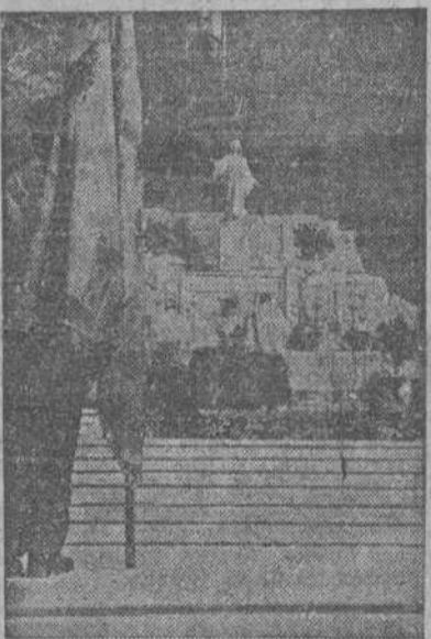
MADRID.—Altar Mayor en el Monumento del Cerro de los Angeles en la Misa celebrada durante la Peregrinación Nacional (Foto CIFRA).