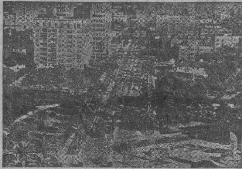
Aspecto parcial de la ciudad de San Francisco, donde mediante una conferencia internacional, tratarán de asegurar la paz mundial todos los países del mundo. (Orbis-Foto).