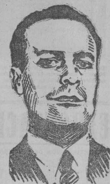
Excmo Sr. D. Blas Pérez, Ministro de la Gobernación

LA SHAGOSIS Habrá también colonias asociadas con la ayuda económica del Ministerio de Trabajo y del Ministerio de la Gobernación. Incluso declare que mis proyectos llegan a alcanzar mayores