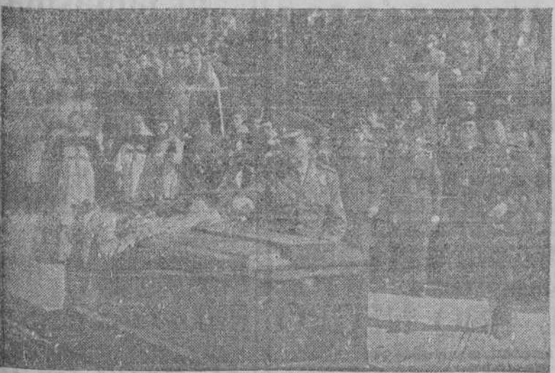
El Director general de la Guardia Civil, General Alonso Vega, impone la laureada sobre el féretro del capitán Cortés. La misma condecoración fué colocada sobre los restos mortales del comandante Haya.

Teléfonos de EL IDEAL GALLEGO 1542, 1277 y 1524