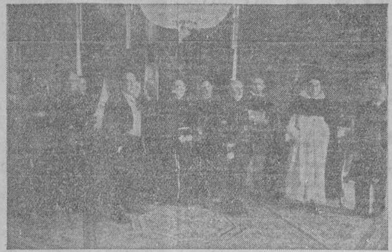
En el Palacio de El Pardo ha recibido S. E. el jefe del Estado a una comisión de Filipinas que le expresaron su agradecimiento por las decisiones tomadas en defensa de los intereses españoles en aquel lugar.

ESPAÑOLES RESIDENTES EN FILIPINAS EXPRESAN SU GRATITUD A FRANCO