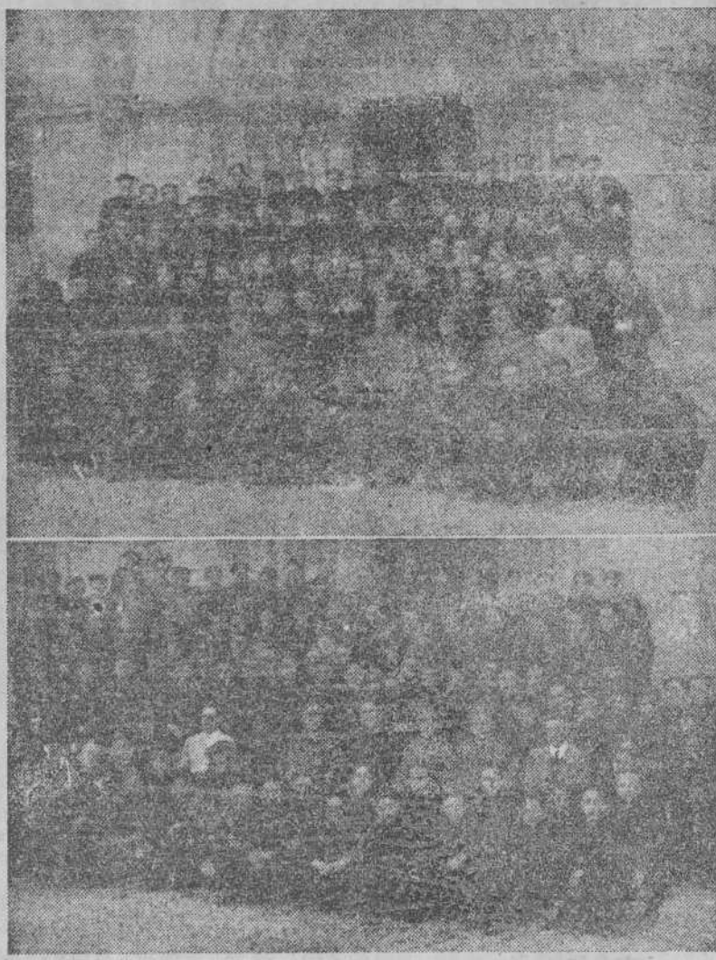
Aprendices de la Fábrica de Armas y de la Maestranza, con sus jefes y profesores, después de haber cumplido con el Precepto Pascual en la Iglesia Colegiata de Santa María