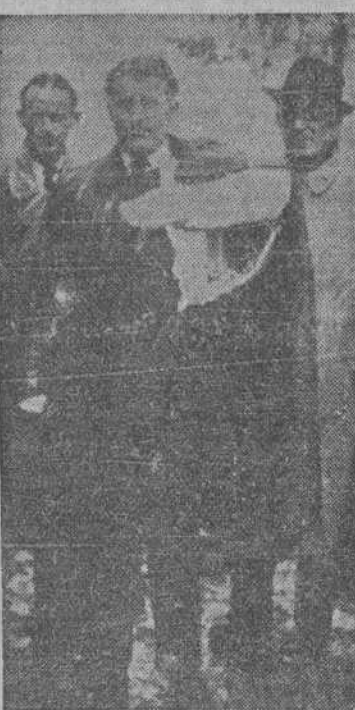
El profesor Von Brick (con el brazo inmovilizado por un aparato para la curación de una fractura), inventor de la “V-2”, después de su captura por las tropas aliadas. (Foto recibida por radio).