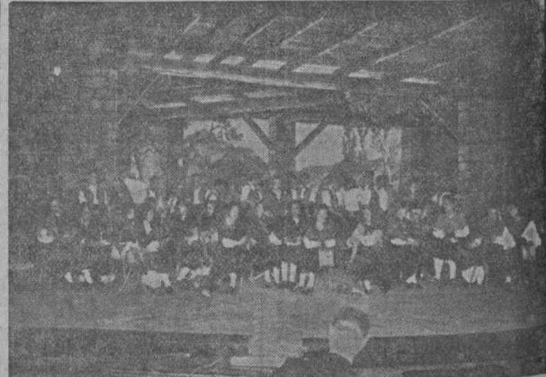
Uno de los cuadros folklóricos representados con franco éxito en el teatro Rosalia Castro por la coral coruñesa "El Eco", que ha reverdecido sus triunfos en la última exhibición pública.