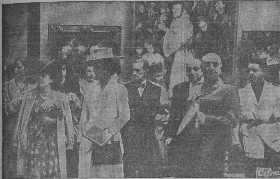
MADRID.—S. E. el Jefe del Estado, Generalísimo Franco, acompañado de su esposa y de otras personalidades, inauguró en el Palacio de Exposiciones del Retiro la Exposición Nacional de Bellas Artes. (Foto CIFRA).

EL CAUDILLO INAUGURA LA EXPOSICION NACIONAL DE BELLAS ARTES