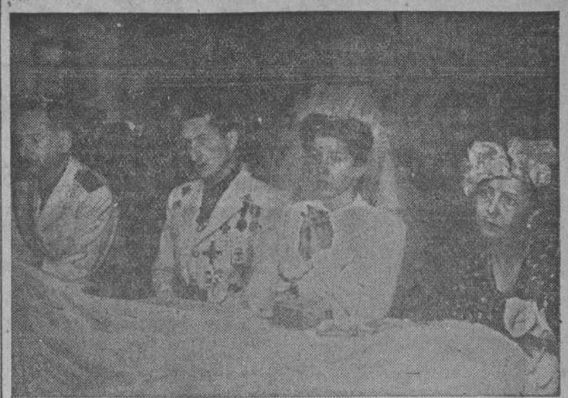
ENLACE SALAS POMBO - BRUQUETAS SAURIN