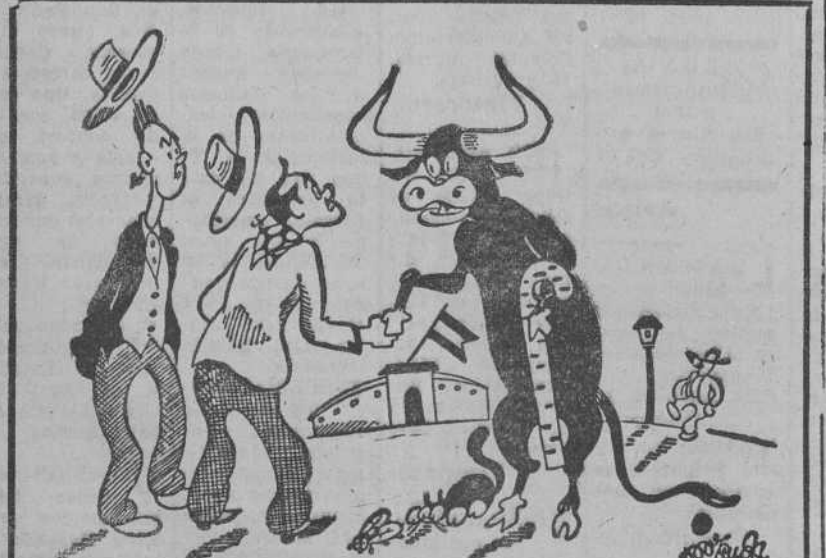
TOROS Y TOREROS, por Miranda

costa y rural, Policía Armada y cincuenta centurias del Frente de Inventiva.—(CIFRA).