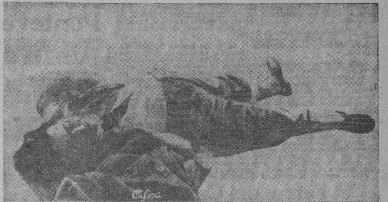
Cadáver de don José Calvo Sotelo, tal y como fué abandonado por sus asesinos en el Cementerio del Este, de Madrid.

Su asesinato fué organizado y ejecutado por las autoridades republicanas Elas rompieron toda norma democrática de convivencia