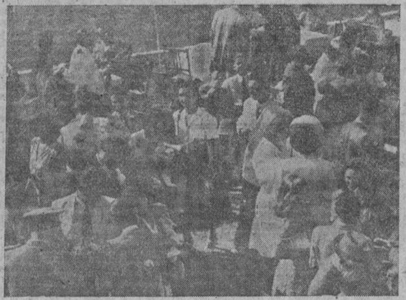
Aspecto parcial de la distinguida concurrencia al espectáculo hípico que se celebra en Riazor

La Torre: Numanca-Fortuna. San Diego (pequeño): C. Caminos-A. Coruñés. San Diego (grande): A. Terranova-Diz S. D.