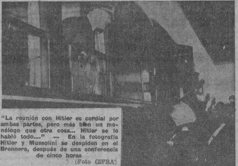
La reunión con Hitler es cordial por ambas partes, pero más bien un monólogo que otra cosa... Hitler se lo habló todo... En la fotografía Hitler y Mussolini se despiden en el Brennero, después de una conferencia de cinco horas

28 de abril.—"Otra carta de Hitler al Duce... Son, en general, de poca importancia, pero Hitler es un buen psicólogo y sabe cómo llegar profundamente al alma de Mussolini... El Papa ha dirigido también una carta al Duce, en la cual elogia los esfuerzos por la Paz y hace votos para que Italia permanezca fuera del conflicto. La re-