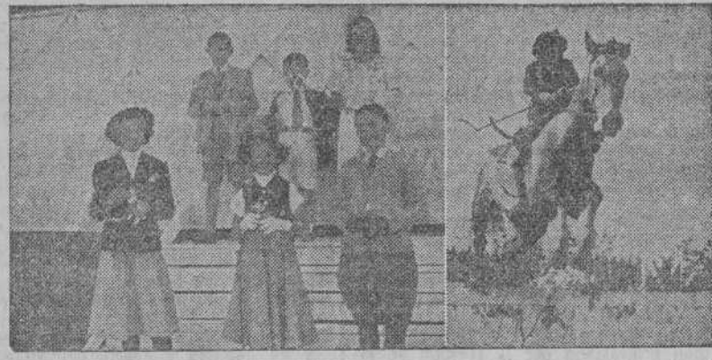
Ayer tarde se celebró con gran éxito la anulada prueba hipica infantil. Ahí tienen ustedes al grupo de los participantes que arrancaron prolongadas ovaciones del público y a una amazona de doce años saltando un obstáculo

Procedente de Madrid llegó a última hora de la tarde, en automóvil, la rejoneadora peruana Conchita Cintrón, que mañana actuará en nuestra Plaza de Toros. Después de cenar, Conchita Cintrón se retiró a descansar, ya que se hallaba bastante fatigada del largo viaje.