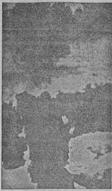
En esta fotografía, tomada desde un avión norteamericano tres minutos después de ser arrojada la segunda bomba atómica sobre Nagasaki, se puede apreciar una enorme columna de humo ascendiendo hasta una altura superior a los 6.000 metros (Foto recibida por radio).