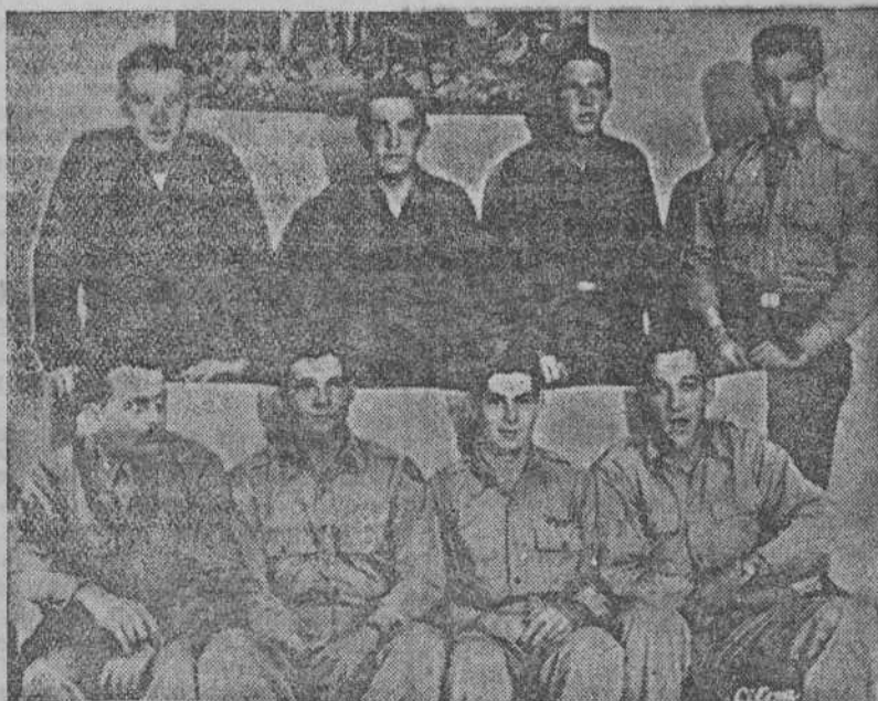
VALENCIA. — Oficiales y soldados de la aviación norteamericana, tripulantes de la fortaleza volante que aterrizó, averiada, en Manises, y que reciben estos días multitud de atenciones en la capital valenciana.