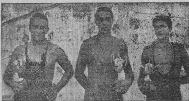
Los tres vencedores de la travesía del puerto de La Coruña

Ayer, a las siete y media de la tarde, se celebró la III Travesía del Puerto de La Coruña, con escaso número de nadadores, caso inexplicable, dado lo corto del recorrido y la enorme cantidad de muchachos que se presentaron para tomar parte en la primera travesía. Confiamos que en años sucesivos habrá más estímulo y se presentarán muchos, puesto que afición no falla. El veterano Bremón sigue dando la nota de deportividad, como todos los años.