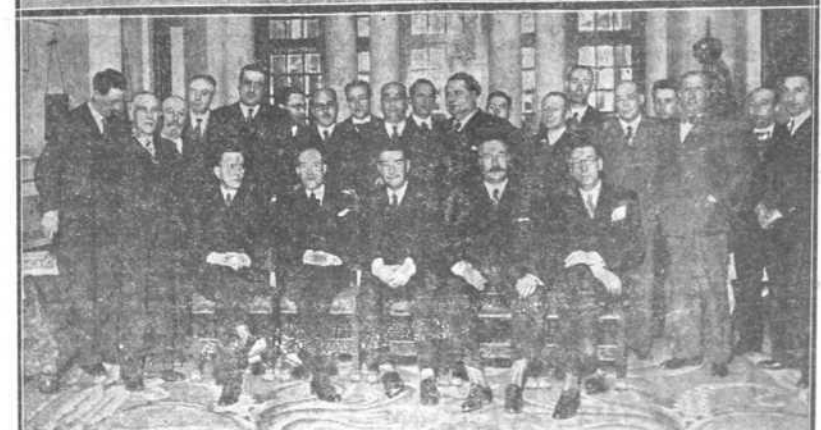
1. Los estudiantes católicos de La Coruña en un acto preparatorio de la fiesta del Estudiante, celebrada ayer en nuestra ciudad con gran brillantez.—2. Banquete ofrecido por las entidades económicas de La Coruña, con asistencia de las autoridades al director general de Puertos.