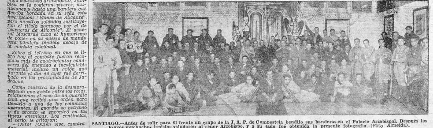
SANTIAGO.—Antes de salir para el frente un grupo de la J. A. P. de Compostela bendijo sus banderas en el Palacio Arzobispal. Después los bravos muchachos japistas saludaron al señor Arzobispo, y a su lado fué obtenida la presente fotografía.

El avance del martes (Crónica referente a las operaciones del martes) En el sector de Córdoba se ocupó Villanueva del Duque.