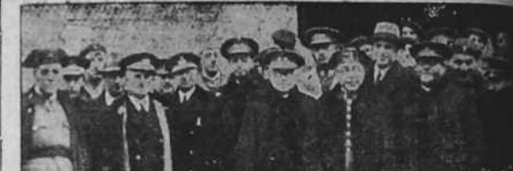
Las autoridades a la salida de los funerales celebrados en San Nicolás por los mártires de la Tradición.