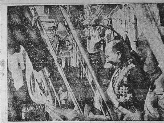
La Plaza Mayor de Salamanca se vistió hace días con sedas del Imperio. Nuestro Caudillo, el jefe del Estado Español, recibió las cartas credenciales presentadas por el Embajador alemán cerca de nuestro Jefe. Con tal motivo Salamanca vibró con fervores hispanos. Gritos de entusiasmo, flamear de banderas, himnos... Y para recibir el homenaje del pueblo, del verdadero pueblo, nuestro Caudillo y el Embajador del Estado alemán se mostraron al público desde uno de los magníficos balcones del Palacio Municipal salmantino, escena histórica que recoge la presente fotografía.